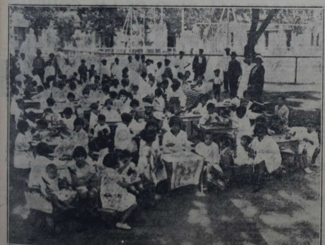
Los pequeños concurrentes al "Recreo Infantil Florentino Ameghino", bajo los árboles de la plaza Herrera.

El transeúnte que desde las 15 a las 18 horas pase por la calle Australia, frente a la plaza Herrera, será atraído por un espectáculo interesante y sugestivo a la vez.