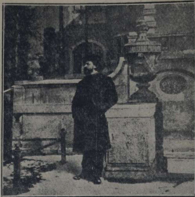
Leonidas Andreiev en el año 1904