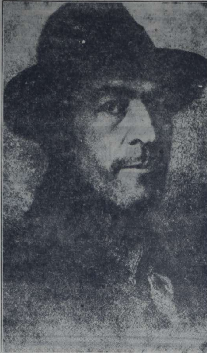
EL DELEGADO OBRERO - Por Lires-Iglesias

Y la pobre mujer se dejaba apasionar, más que por nada, por la idea de justicia que tenía el joven.